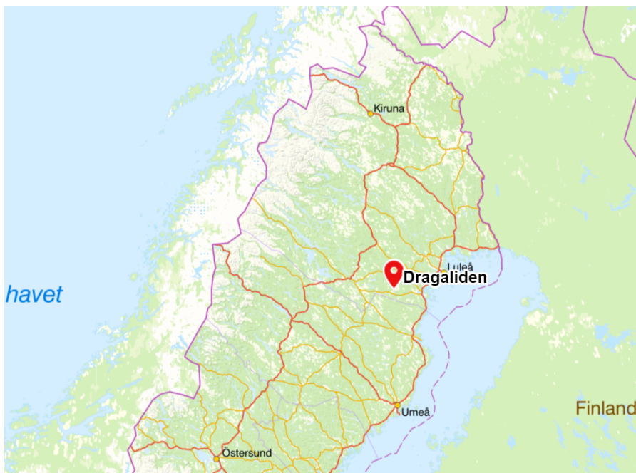
Figur 2: Karta över elnätets geografiska lokalisering.

Figur 2 visar en mer utzoomad bild på området för att ge läsaren en bättre överblick över i vilken del av landet företagets elnät finns.